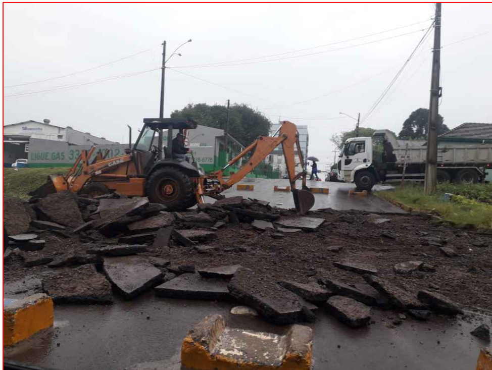
Demolição de Pavimentação Asfáltica