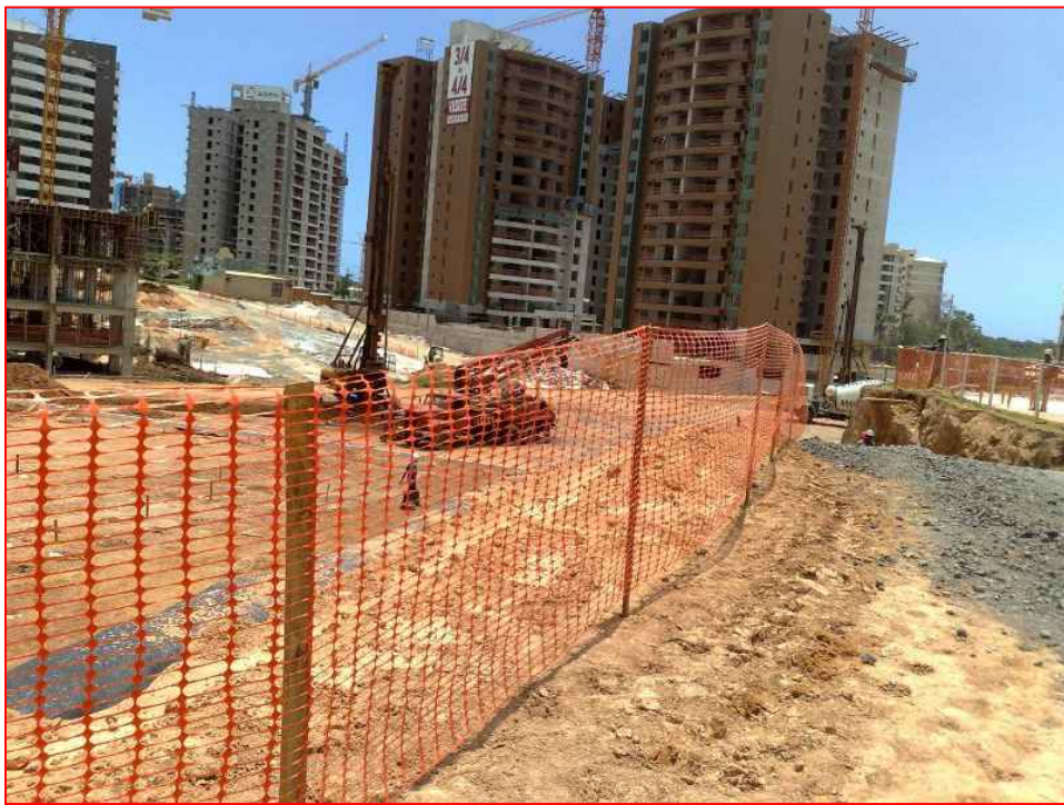
Tapume Feito de Tela Plástica na cor Laranja