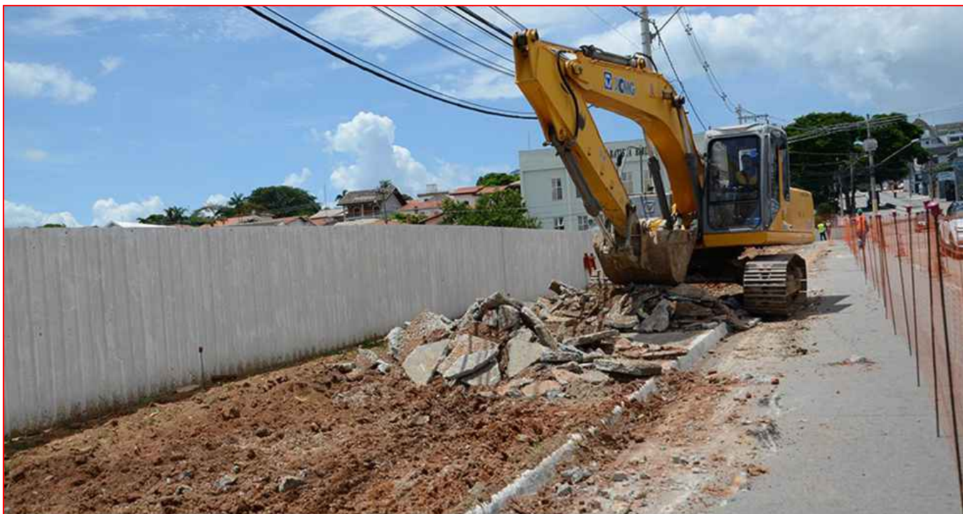
Remoção de Pavimento Intertravado "Paver"

– A REMOÇÃO DAS ÁRVORES EXISTENTES DEVERÁ SER FEITA APENAS MEDIANTE AUTORIZAÇÃO PRÉVIA DE ÓRGÃO COMPETENTE.